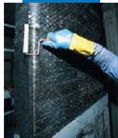
Applicazione della 2ª mano di Mapewrap 31