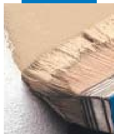
Rivestimento con Elastocolor