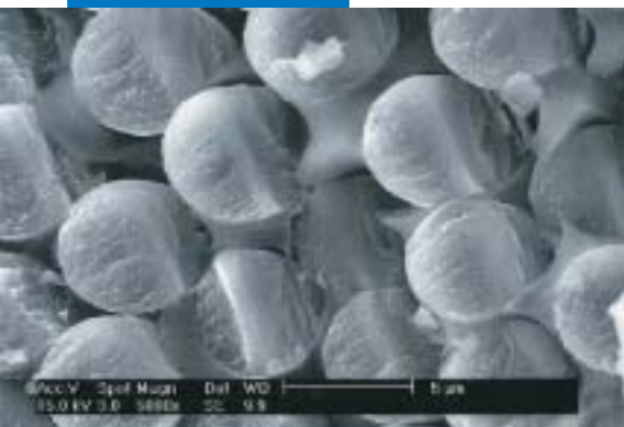
Microfotografia di un composto strutturale a matrice polimerica dal Laboratorio di Ricerca e Sviluppo Mapei

Le referenze relative a questo prodotto sono disponibili su richiesta