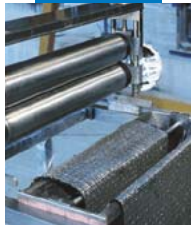
Impregnazione a macchina di Mapewrap C