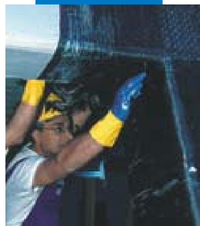
Fasciatura di un nodo