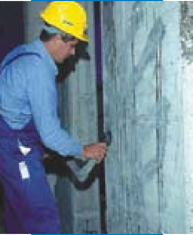
Preparazione del supporto