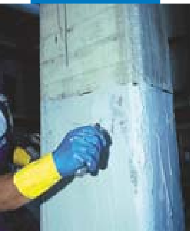
Rasatura con Mapewrap 11 o Mapewrap 12