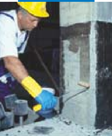
Applicazione di Mapewrap Primer 1