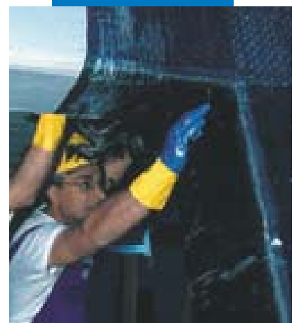
Fasciatura di un nodo